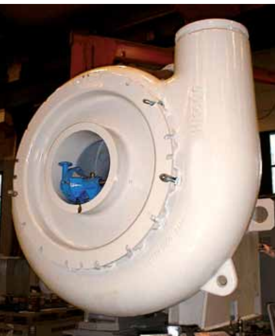
XM 600 mit MM25 in der Mitte