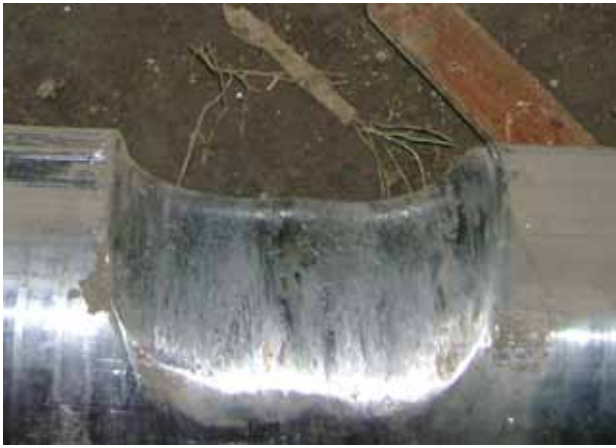
Standard Hammerachsen zeigen nach 50.000 Produktionstonnen signifikante Verschleißspuren.