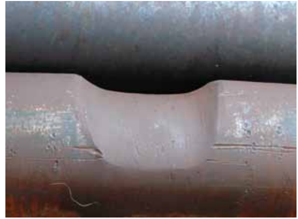
Der Verschleiß der Metso LongLife Hammerachse ist nach 50.000 Produktionstonnen erheblich geringer.